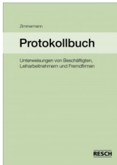
Dokumentationsmöglichkeit für Unterweisungen (Resch-Verlag)

Allerwichtigste Prämisse ist es, dass der Inhalt der Unterweisung bei den Unterwiesenen „angekommen“ ist – denn sonst muss die Unterweisung wiederholt werden. Empfehlenswert bei theoretischen Unterweisungen sind Testfragen, die die Unterwiesenen am Ende der Unterweisung beantworten müssen. Diese Fragen und Antworten sind vom Unterweiser zu besprechen und Fehler zu erklären, bis die Teilnehmer alles verstanden haben.