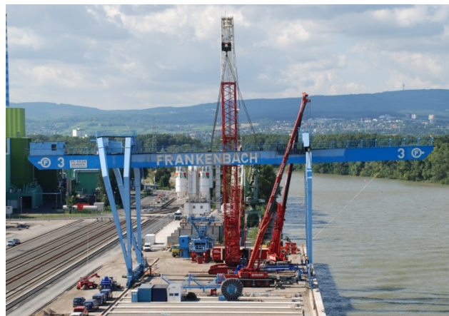
Arbeiten mit mehreren Kranen

Das ist klassisch der Fall, wenn schwierige Montagearbeiten auf der Baustelle vorgenommen werden müssen oder mehrere Krane zusammenarbeiten müssen – wie bspw. beim Tandemhub.